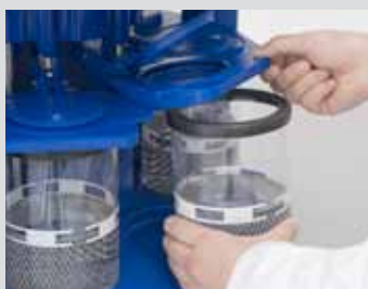
Gläser befüllen und einsetzen

Elmasolvex® RM mit umfangreichem Zubehörprogramm