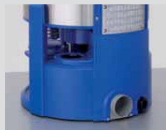
Anschluss an kontrollierte Abluftführung