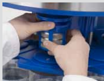
Korb mit Uhrenteilen einsetzen